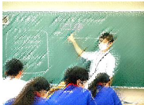
2年生の道徳授業の様子

9月から11月にかけて、上越教育大学大学院の4人の院生とともに、道徳の授業づくりを行っています。「深い学び」を目指して授業の流れを一緒に検討し、時には院生が授業を行ったり、職員と院生と一緒に授業を行ったりしています。また、授業を通して生徒1人1人にどんな学びがあったのかを分析し、次の授業づくりに生かしています。