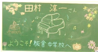
1年生の実行委員が描いてくれた歓迎黒板