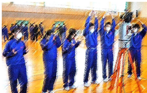
3Dレーザースキャナー体験

この日は、まず、建設産業についての説明を聴講しました。女性部の方からの説明もあり、土木業界では実は多くの女性が働いていることもわかりました。次に、体育館で実習を行いました。ドローンを操縦して上空から何枚も写真を撮ることで、正確な測量を行うことや、3Dレーザースキャナーを使用して、自動で周囲の距離や凹凸を測定することなど、最新の測量機器を体験しました。最後には上空のドローンから集合写真を撮影しました。