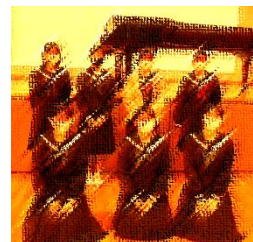
実行委員のみなさん

今回、実行委員を務めてくれたのは、この日に予定されていた合唱祭で伴奏をするはずだった7人の生徒たち。