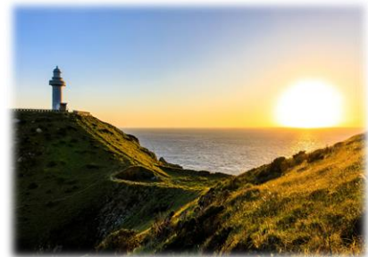
福江島 大瀬崎の夕日

たくさんの出会いが、生徒一人ひとりをさらに大きく成長させてくれることを期待しています。