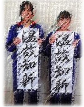
左から KHさん、KKさん、KHさん、TAさん