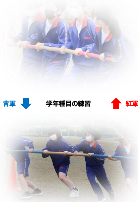
青軍 ↓ 学年種目の練習 ↑ 紅軍

当日も含め、来週の天候があまりよくありません。生徒とともに、何とかよいコンディションの中で実施できるよう祈りたいと思います。