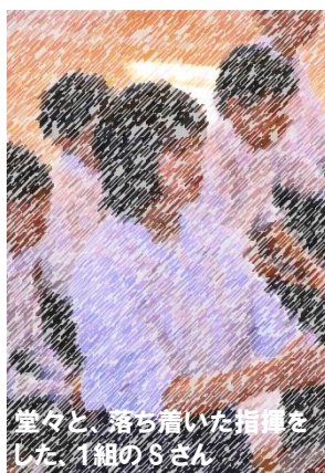
堂々と、落ち着いた指揮をした、1組のSさん

ただ、その後の3年生の発表は圧巻で、誰もが「さすがは3年生!」と感じたと思います。その歌声に、2年生全員が1年後の自分たちの目指す姿をイメージできたはずですので、その印象を忘れることなく、来年更に素晴らしい合唱を披露してくれることを期待します。