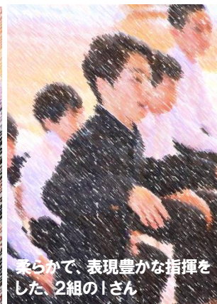
柔らかく、表現豊かな指揮をした、2組のIさん