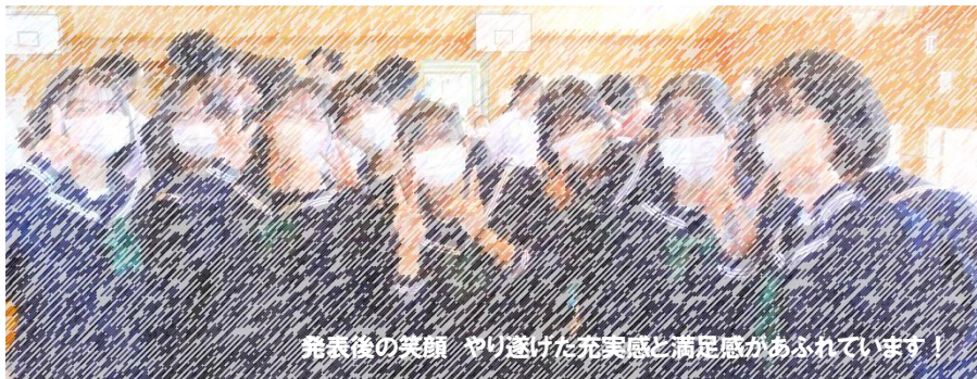
発表後の笑顔 やり遂げた充実感と満足感があふれています!

当日は、お忙しい中、大勢の保護者の皆様においでいただき、生徒にとって大きな励みとなりました。おいでいただきました皆様に、心から感謝いたします。ありがとうございました。